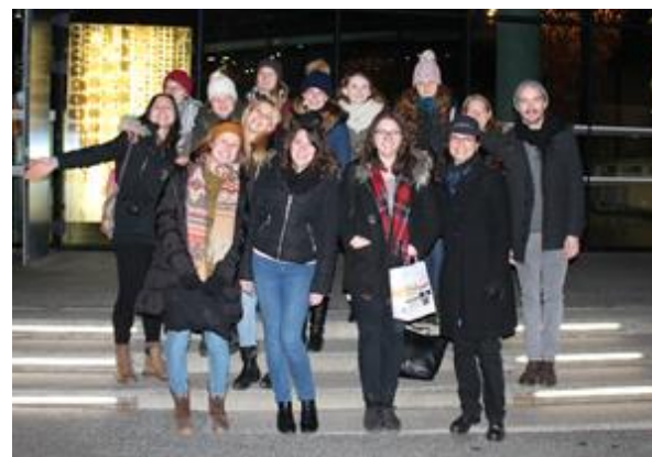
Utrinka s strokovne ekskurzije na avstrijsko Koroško (Pliberk) in Štajersko (Gradec).