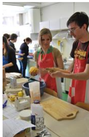
Primer izvirnega strokovnega zgodovinskega besedila ter utrinek s kulinarčne delavnice.